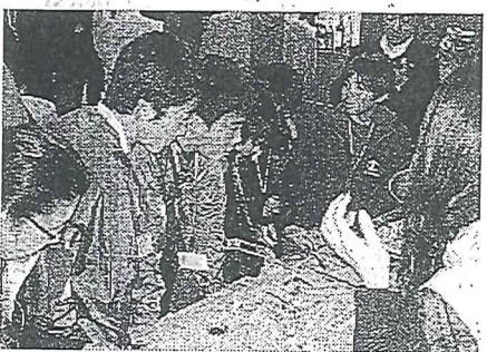
廃油からのろうそく作りを 体験しているようす

「千葉県産業廃棄物協 会の方たちには、細か い部分まで非常によく していただけました。放射 能の問題などで、外で の活動が制限されてい て、子どもたちにとっ て、子どもたちにとっ ても久しぶりの試合だ った。子どもたちも大 変喜んでおり、感謝し ている」と述べた。